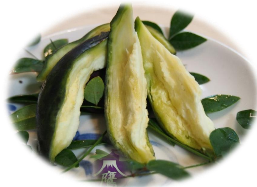
⑤薬味を添えると美味しさが増します