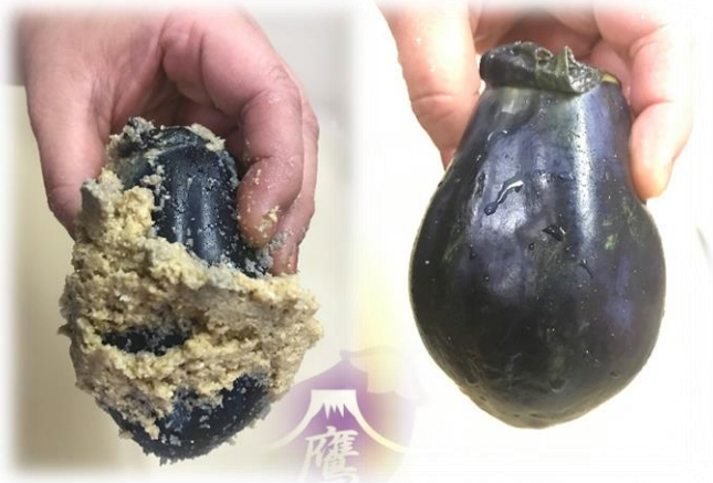
①ぬかを洗い流します