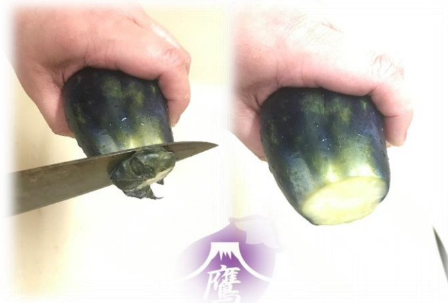
②へたを切り落とします